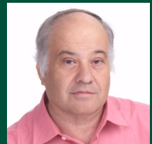
פרופ' רון אונגר