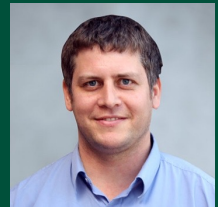
פרופ' ארז לבנון