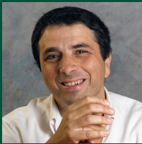
פרופ' יורם לוזון