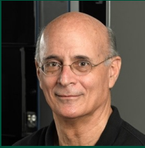
פרופ' גידי רכבי