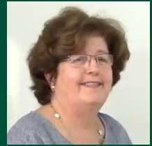
פרופ' נינט אמריליו