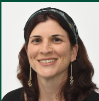
פרופ' מלי שלמון-דיבון